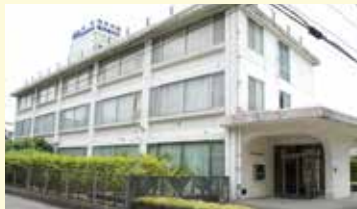
向井内科・脳神経内科外観