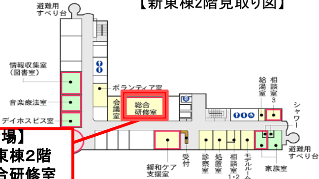
【新東棟2階見取り図】