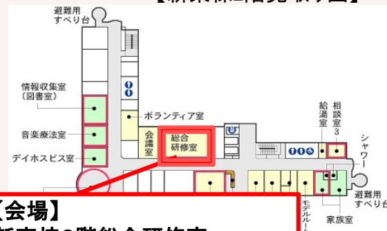
【新東棟2階見取り図】