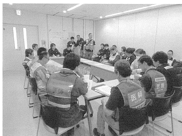
写真3 熊本阿蘇医療センター“ADRO”でのミーティング

阿蘇地域の医療支援は、毎朝7時30分から阿蘇医療センターで行われるミーティング（写真3）でその日ごとの各支援チームが行うべきミッションが割り振られる。広島JMAT先遣隊及び第1班も朝のミーティ