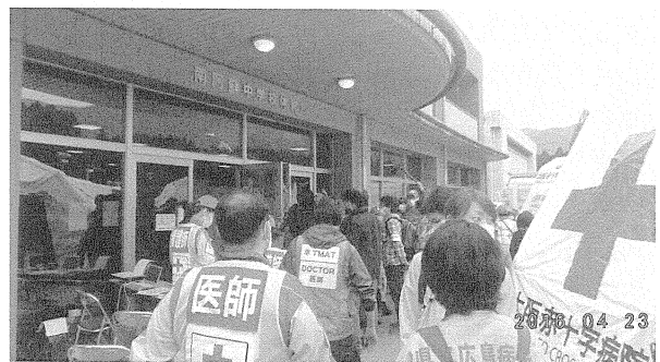
写真1 4月23日 感染性胃腸炎の集団発生があった避難所の訪問

感染性胃腸炎の集団発生が起こった避難所の状況把握活動を行った(写真1)。中学校体育館は土足厳禁になっておらず, 感染対策での遅れが集団発生を招いた。道路は地割れが激しく, 東海大学体育館訪問は,